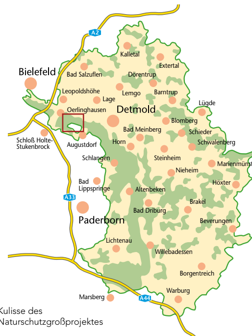
Kulisse des Naturschutzgroßprojektes